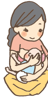
フットボール抱き