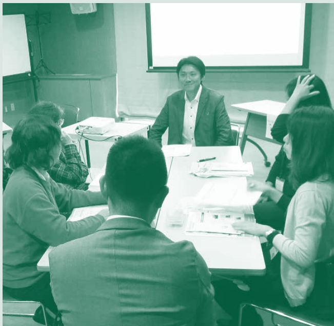
トークセッションの様子

創業計画書作成支援、セミナー・創業塾の開催等を行っています。 詳しくは下記サイトをご覧ください。