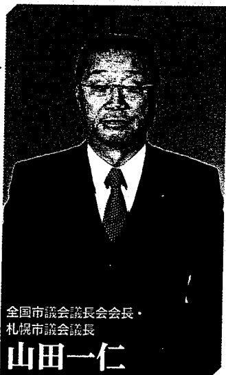
全国市議会議長会会長・ 札幌市議会議長