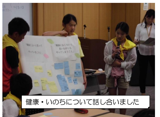
健康・いのちについて話し合いました