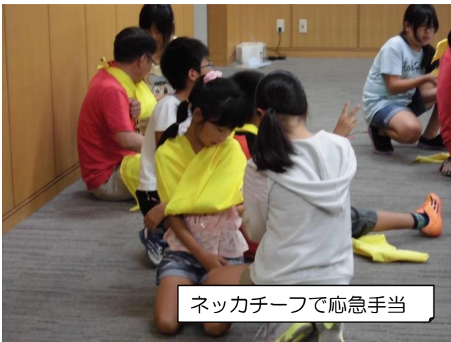
ネックチーフで応急手当