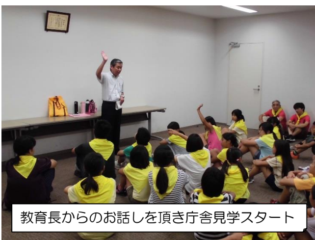
教育長からのお話を頂き庁舎見学スタート