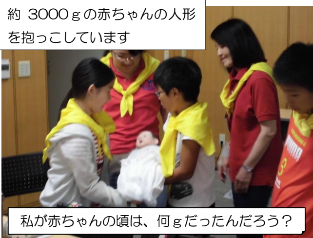
約 3000 g の赤ちゃんの人形 を抱っこしています