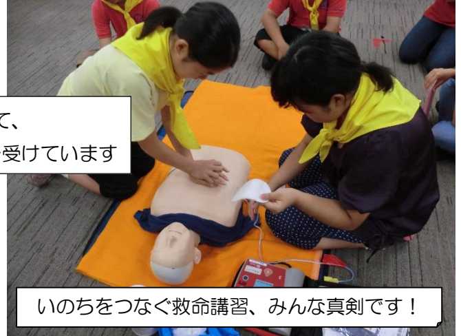
いのちをつなぐ救命講習、みんな真剣です！