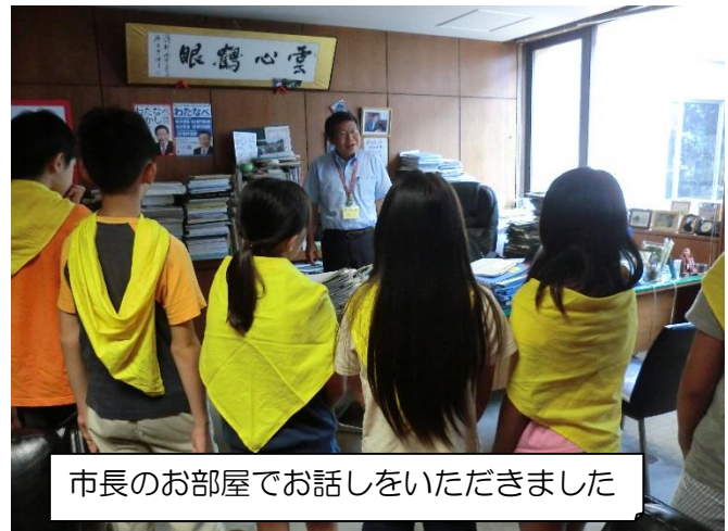
市長のお部屋でお話をいただきました