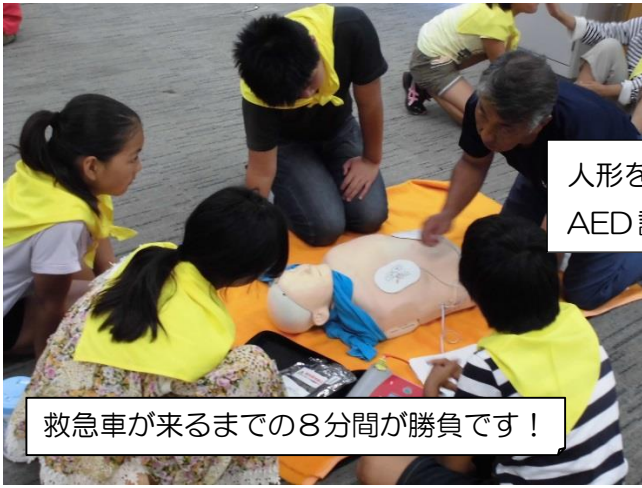
人形を使って、 AED講習を受けています