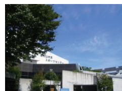
市民スポーツセンター

避難所では、感染拡大防止のため必ずマスクを着用することや避難所内での移動制限などをお願いすることがあります。ご理解ください。