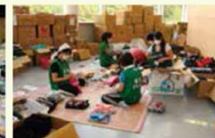
ボランティアによる救援物資の仕分け