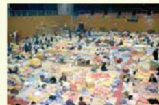
体育館を使った避難所

学校が避難所になっている場合は、小さい子の面影をみたり、救援物資の移動や配布等を行ったりする。