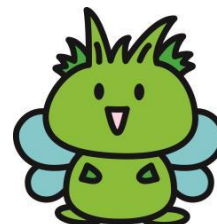
東村山市公式キャラクター 「ひがっしー」

東村山市 経営政策部 都市マーケティング課 Tel : 042-393-5111 (内線2242) Fax : 042-393-6846 E-mail: toshimarketing@m01.city.higashimurayama.tokyo.jp