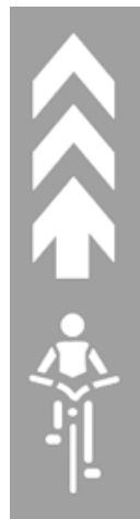
参考図1 「自転車ナビマーク」