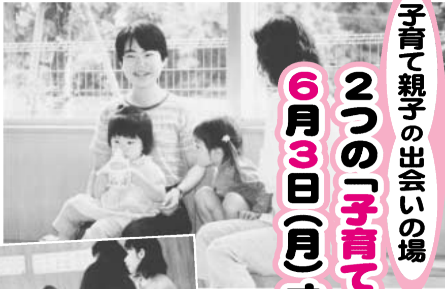
子どもも親も、リラックス(本町児童館)