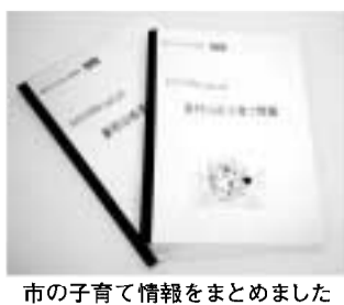
市の子育て情報をまとめました

発行時期 5月末日 設置場所 各児童館・図書館 子ども家庭支援センター(市民センター1階) 問い合わせ 子育て推進担当