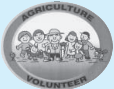
援農ボランティアのシンボルマーク