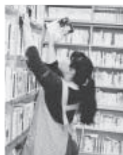
図書館学生ボランティアが活躍しています