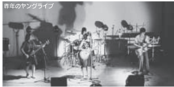
昨年のヤングライブ