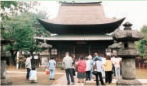
施設めぐりで国宝正福寺地蔵堂を見学するようす

市民の皆さんに市の公共施設等を案内します。 さわやかな春の一日、バスで施設めぐりをしてみませんか。 日時 5月7日(水) 午前9時30分(市役所前集合)午後3時30分頃 見学地 ふるさと歴史館、正福寺地蔵堂、富士見文化センター、秋水園、秋津ちろりん村、高松宮記念ハンセン病資料館等(市バス利用) 定員 28名(応募多数の場合は抽選) 参加費 無料 ※弁当持参、雨天決行 申込み 往復はがき(1枚2名まで)に、住所・氏名(返信用にも)・電話番号 施設めぐりで国宝正福寺地蔵堂を見学するようす