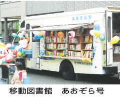
移動図書館 あおぞら号

おはな会スペシャル 日時 4月24日(木) 場所 富士見図書館 時間 午後3時30分～4時 (幼児)・4時～4時30分(小学生) おはな会スペシャル 日時 4月24日(木) 場所 富士見図書館 時間 午後3時30分～4時 (幼児)・4時～4時30分(小学生)