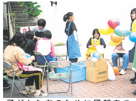
子どもたちのために風船をつくる学生ボランティア (昨年の同まつり)

みんな生まれ！物語からとびだしたお人形たち 富士見図書館との協力のよによる人形劇の人形や原作本の展示を行います。 日時 4月26日(土)・27日(日) 午前10時～午後3時30分 場所 富士見図書館 おもしろ本みつけた 図書館からの、そして子ども自身からのおすすめ本を展示します。 日時 4月23日(水)～5月4日(日) 場所 富士見・秋山・秋津・廻田図書館