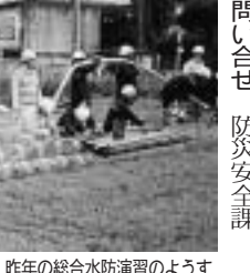
昨年の総合水防演習の様子

日時 5月9日(金) 午前10時開始 10時開始 演習場所 都営住宅跡地(本町3-3)