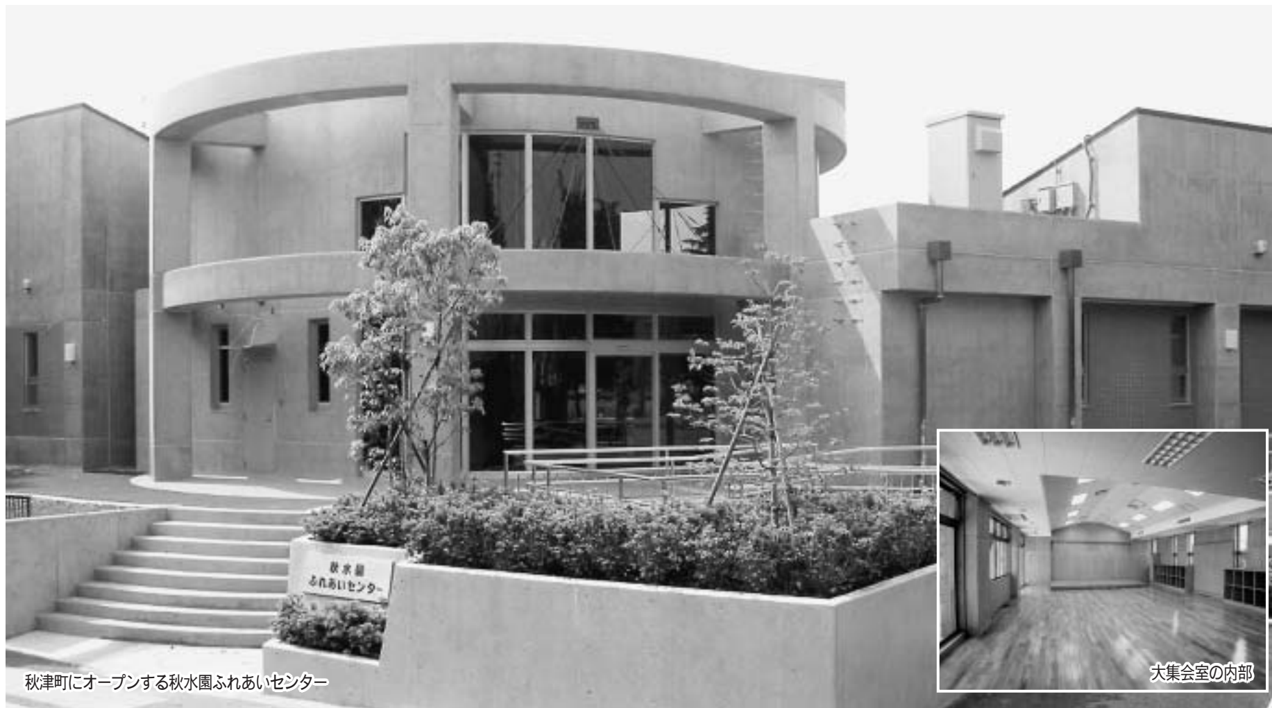
秋津町にオープンする秋水園ふれあいセンター