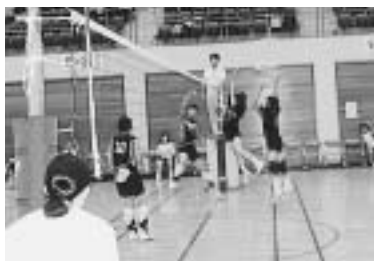
昨年の大会のようす

今年も7月19日(土)の開会式をスタートとして、市内公立中学校の生徒によるスポーツ大会が左表の日程で開催されます。 スポーツに全力で取り組む中学生に、皆さんのご声援をお願いいたします。 問い合わせ 指導室