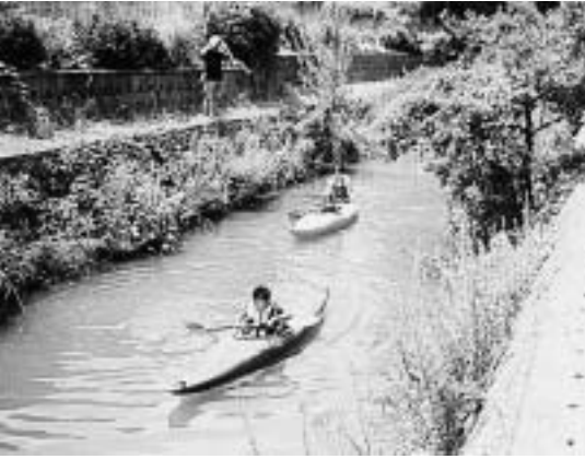
昨年のわんぱく夏まつりのようす

八国山を背景にして、水と緑豊かな北山公園・北川を舞台に、子どもも大人も自然の中でわんぱくになって遊びませんか。 日時 8月3日(日) 午前10時～