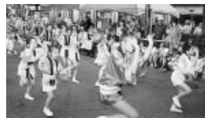
昨年の阿波踊り大会