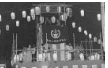
市民納涼の夕べのようす

後援 市、市教育委員会 主催 市、市教育委員会 問い合わせ 東村山市体育協会(397・1212)