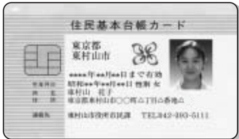
顔写真付き住基カード(見本)