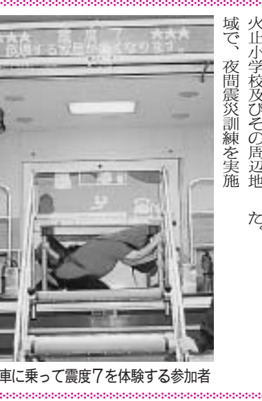
起震車に乗って震度7を体験する参加者

去る7月19日(土)に野火止小学校及びその周辺地域で、夜間震災訓練を実施しました。 4回目となった今回の訓練では、参加した市民の皆さんに避難場所や応急手当や起震車に乗って震度7を体験していただくなど、より実践的な訓練となりました。