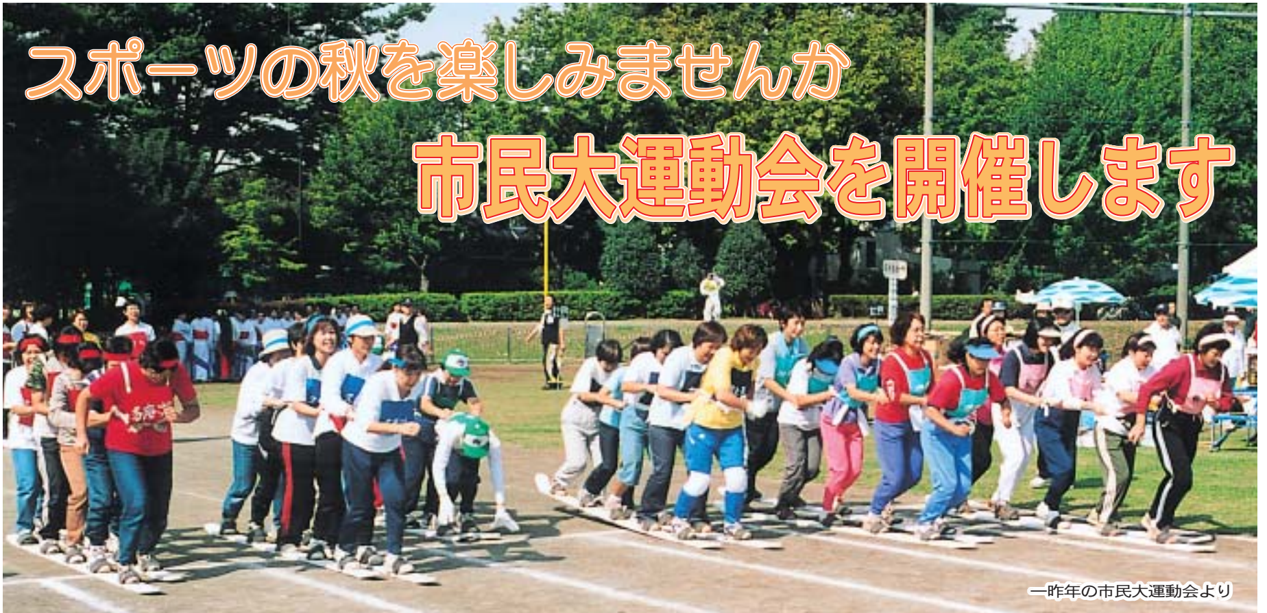
—昨年の市民大運動会より

子育て講演会・2003年子どもフェスタ…2面 市民文化祭作品募集・多摩六都・健康…3面 第40回市民大運動会プログラム…4面 公民館・図書館・歴史館…5面 夢ハウス・消費生活・官公署…6面