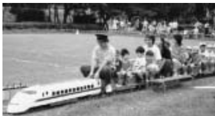
ミニ新幹線に乗る子どもたち

対象 中学生以下のお子さん(幼児は保護者同伴) 内容 ○屋外レクリエーション ミニ新幹線の試乗・クイズの森・工作コーナー・昔遊び、○屋内レクリエーション 将棋コーナー・おはなしひろば・木まぐれ工房の