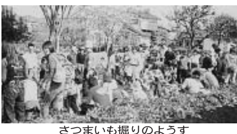
さつまいも掘りのようす

秋津ちろりん村は、市民の皆さんとともに、農作業を通して緑の大切さを学ぶ体験農園です。