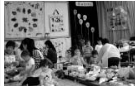
布の絵本プレイルームで遊ぶ子どもたち

筋肉と皮膚のメカニズムを知り、年齢・性別を問わず豊富な顔を作るエクササイズで大変身しませんか。 日時 11月22日(土) 午後2時～4時 場所 廻田公民館 対象 市内在住・在勤・在学(高校生以上)のかた