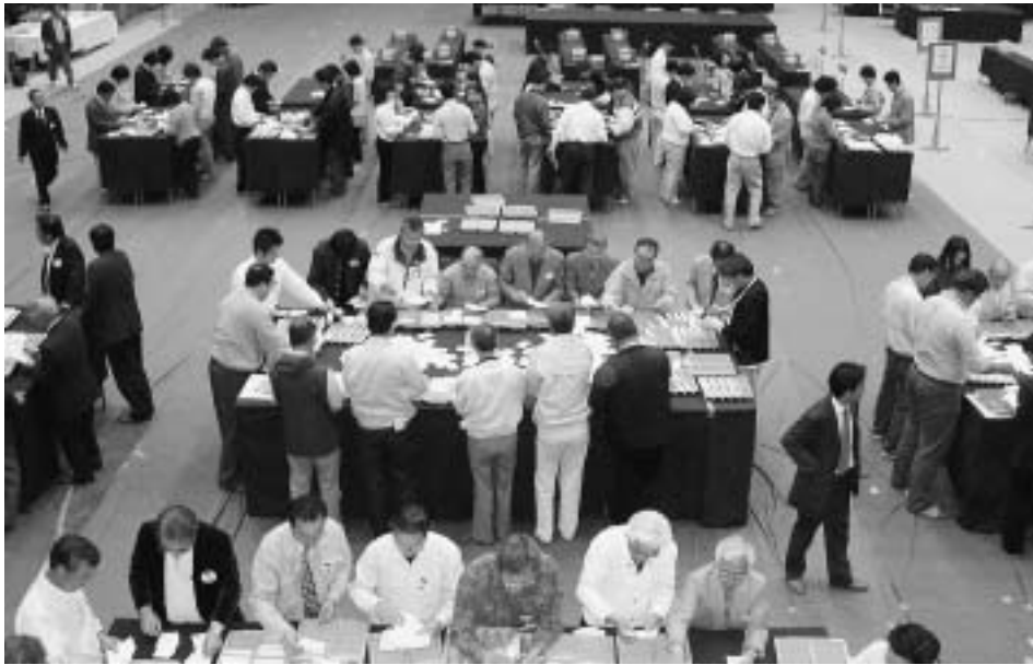
今年4月に行なわれた統一地方選挙の開票風景

11月9日(日)は、衆議院議員選挙と最高裁判所裁判官国民審査の投票日です。 この選挙は、これからの国政の担い手を決める大切な選挙です。 貴重な一票をむだにしないように、必ず投票しましょう。