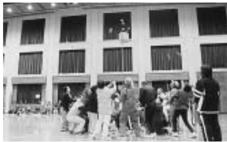
ふれあい運動会「玉入れ」の様子

60歳以上のかたを対象に、簡単に誰でも楽しく参加できる運動会を開催します。心地よい汗を流して、楽しい一日を過ごしませんか。 日時 11月23日（祝）午前9時受付開始（午前9時30分開会式）～午後2時30分頃 場所 スポーツセンター 対象 60歳以上の市内在住のかた 服装・持ち物 運動のできる服装、室内用運動靴、弁当、飲み物 参加費 無料 申込み 11月6日（木）から電話でスポーツセンター