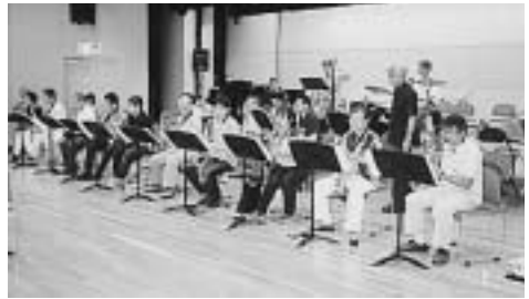
修了コンサートに向けて練習する養成講座の様子

日時 12月7日(日)午後2時開演(午後1時30分開場) 場所 西東京市市民会館(西東京市田無町4-15) 11、西武新宿線田無駅北口下車徒歩約7分) 定員 50名(応募者多数の時は抽選) ゲスト 北村英治氏(クラリネット奏者) 入場料 無料(入場整理券が必要) 入場整理券 往復はがき住所・氏名・電話番号・入場者数(一枚4名まで)を明記し、11月10日(必着)までに西東京市生活文化課「多摩六都ジャズバンド養成講座」担当