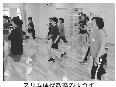
スリム体操教室のようす

肥満や生活習慣病(高脂血症・高血圧症等)を予防したいかたの運動コースです。 日程 16年1月14日・21日・28日、2月4日・18日・25日、3月3日・10日の水曜日 時間 午前10時~11時30分 場所 いきいきプラザ1階運動指導室 対象 市内在住の30歳~59歳のかたで、運動をして体に支障のないかた