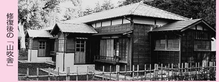
修復前の男子独身寮山吹舎 修復後の「山吹舎」

通るやすくなるように、お茶などを飲みながら一緒に食べる。 ③自分の飲酒量を知り、一気飲みはしない。 東村山消防署