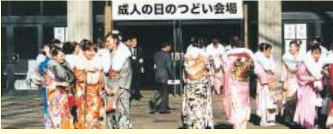
昨年の「成人の日のごい」