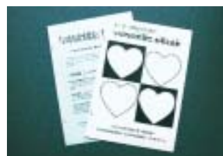
図書館で発行されているブックリスト

各図書館では、教育週間の制定に伴い、1月中旬から「いのちの大切さ」を伝える本の展示コーナーを設け、貸出しを行なうとともに、ブックリストを発行します。「いのち」について考える大切な一冊に巡り合えるかもしれません。ぜひご利用下さい。 ブックリスト 〈大人向き〉 『いのちの大切さ』を考