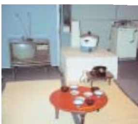
なつかしい道具の展示

ふるさと歴史館には、毎年たくさん小学生が社会科見学で、「昔がし」をテーマに来館します。その時に見学する多くの民具などは、小学生の保護者や祖父母のかたが以前、家庭などで使っていたなつかしい道具ばかりです。教育週間に伴い、子どもたちが知らない少し昔の暮らし