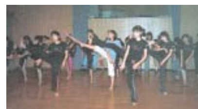
ヒップホップダンスを踊る子どもたち

名・住所・氏名(ふりがな)・年齢・電話番号を明記し、1月27日(必着)までに中央公民館(〒189-0014本町2-33-2)へ ※返信宛先等必ず記入 ※車でのお来場はご遠慮下さい。 問い合わせ 中央公民館(☎395-7511)