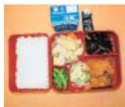
中学校給食の一例

当市では、昭和32年に小学校2校で学校給食を開始し、現在、小学校は全15校、中学校は全7校で学校給食を実施しています。特に中学校では、家庭からの弁当併用外注方式を選択する弁当併用外注方式の給食を採用し、60%を超える生徒が利用しています。食事は体を育てるだけでなく、心がリラックスできる時間を育むことができます。 中学校給食の一例