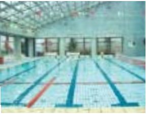
スポーツセンター屋内プール

スポーツセンターでは、親子のふれあいを応援するため、屋内プールを利用する親子(祖父母を含む)を対象に、お子さんへの無料開放を行います。 開放日 2月2日から毎月第1月曜日 開放時間 午前9時~午後9時30分(入場は午後8時30分まで)