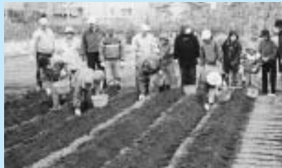
昨年のじゃがいもの植え付け作業

市民の皆さんとともに農作業を通して、自然の恵みの大切さを学ぶ体験農園「秋津ちろりん村」で、じゃがいもの植え付けを行います。ぜひご参加下さい。