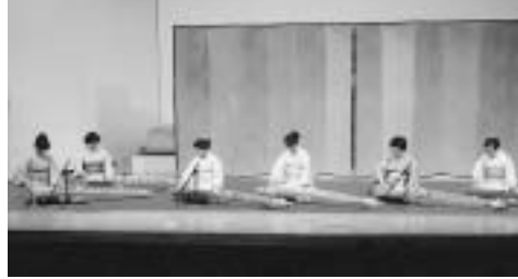
昨年の文化のつどいのような