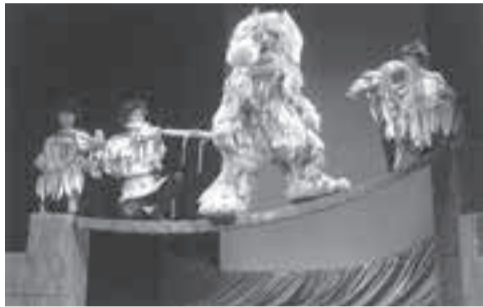
三匹のやぎのがらがらごんの一場面

日時 2月5日(土) 午前10時30分〜正午・午後2時〜3時30分の2回公演 ※開場は15分前 場所 中央公民館3階ホール 対象 3歳〜18歳までのかた(小学3年生以下は保護者同伴) 定員 各回先着40名 費用 500円(入場料) 申込み 所定の申込み用紙に費用を添えてチケットを購入