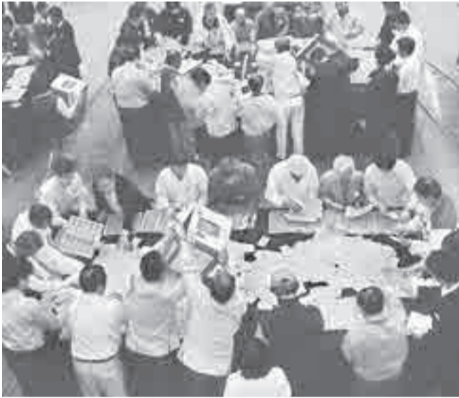
スポーツセンターでの開票風景

9月11日(日)は、衆議院議員選挙と最高裁判所裁判官国民審査の投票日です。この選挙は、これからの国政の担い手を決める大事な選挙です。貴重な一票を大切に、必ず投票しましょう。