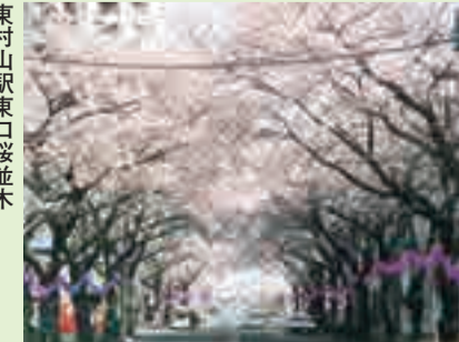
水道ふれあいお花見広場