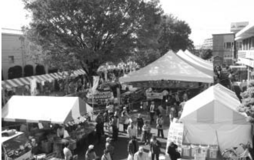
昨年の市民産業まつりのようす