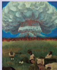
「8月6日の空」 作/坂本 茜さん