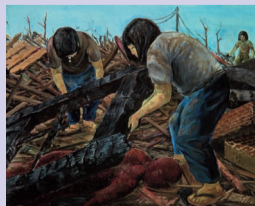
「原爆投下後、初めて行った学校で」 作/永井 攻さん