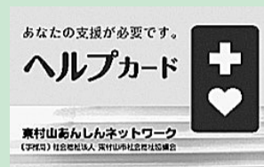
ヘルプカード(表面)