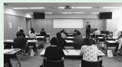
平成30年度に行った同行援護従業者養成研修の様子

※新型コロナウイルス感染拡大の影響により、研修の日程や会場を変更する場合は受講予定者に別途、お知らせします。