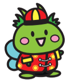
東村山市公式キャラクター「ひがっしー」