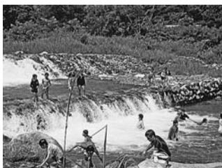
白州山の家一泊キャンプでの川遊び

市内7つの中学校区ごとに活動している東村山市青少年対策地区委員会は、「地域の子どもは地域で育てる」という考えのもと、野外体験やさまざまな体験活動を通じて、子どもたちが社会性豊かな心を育むための青少年健全育成活動をしています。各地区の委員会では委員を募集しています。 委 5月から2年間 内 白州山の家一泊キャンプ、こどもまつり、各種レクリエーション等の企画・運営