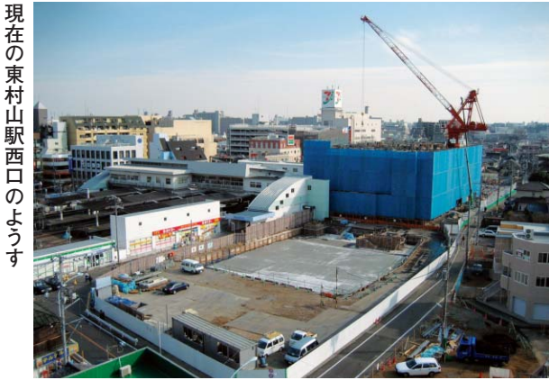
現在の東村山駅西口のようす 仮設駅前広場の運用開始 工事期間中の駅の利用について

後期高齢者医療制度、国保、市営住宅...2面 児童扶養手当、民生委員・児童委員、健康...3面 義務教育費の一部援助、スポーツセンター...4面 児童館、夢ハウス、科学館、みんなのひろば...5面 今月の相談、ふるさと歴史館、社協、官公署...6面