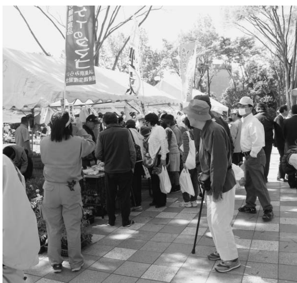
野菜の販売会のようす

市税(市・都民税、固定資産税・都市計画税、国民健康保険税、軽自動車税)納付の日曜窓口を開設します。 当日は納税相談も行っていきますので、ご利用ください。 日時 4月27日(日) 午前8時30分～午後8時 場所 本庁舎2階納税課 ※地下1階の夜間受付よりお入りください。 ★4月27日(日)は、秋津・萩山・富士見・廻田の各公民館でも午前9時～午後3時まで臨時納税窓口を開設します。(平成19年度分のみ納付受付。納税相談は行いません。)