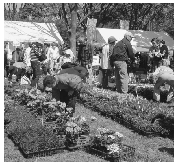
植木・花の販売会のようす