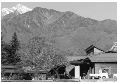
白州山の家の周辺の様子

白州では、南アルプスの残雪に映える山ろくの木々の新芽が輝いています。新緑を染しみ、おいしい空気を吸って心と体をリフレッシュさせませんか。また、白州山の家周辺で