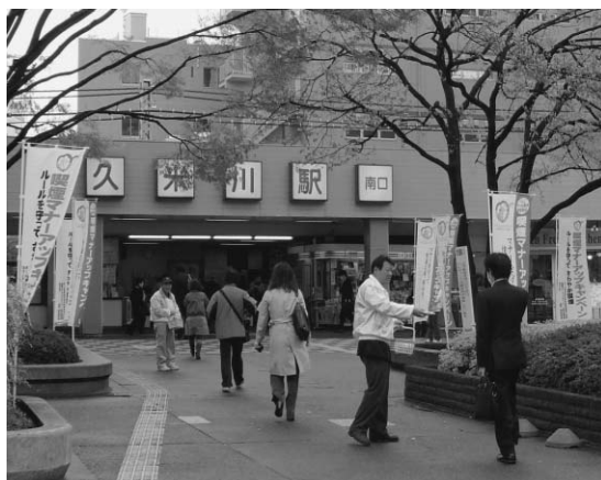
条例施行を周知するキャンペーンの様子

市民表彰、春の叙勲・褒章、市民相談…2面 自転車のマナーやルール、駐輪場…3面 特定健診・後期高齢者健診…4面 図書館、スポーツセンター、夢ハウス…5面 空堀川・川まつり、消費生活、官公署…6面