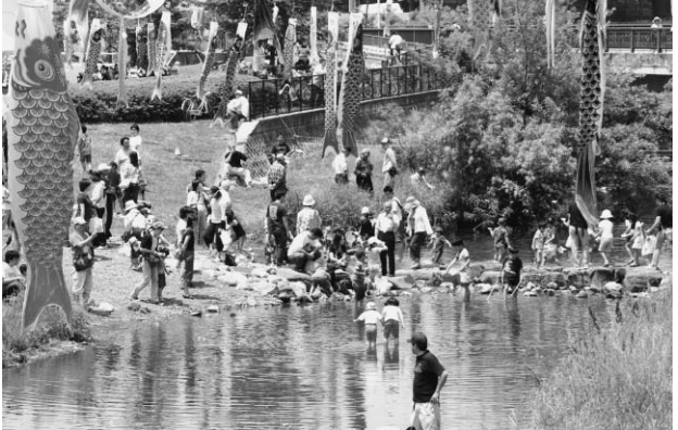
昨年の川まつりのようす