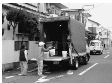
生ごみ集団回収の様子

市では、生ごみのリサイクルを進める集団回収事業を行っています。同事業は、地域の5世帯以上が集まったグループ又は団体がそれぞれの家庭から出る生ごみを分別し、決まった日時・場所に集めたものを、市が無料で回収して生ごみの堆肥化等を行います。参加にあたり専用バケツが必要になりますが、購入費の一部を市で補助します。ぜひ、ご参加ください。