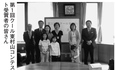
第1回クール東村山コンテスト受賞者の皆さん

応募用紙等配布場所 情報コーナー（本庁舎1階）、各公民館、管理課（秋水園内・秋津町）、美住リサイクルショップ（夢ハウス） ※応募用紙等は、市のホームページの「新着情報」からダウンロードできます。 コンテストの内容 7月～9月