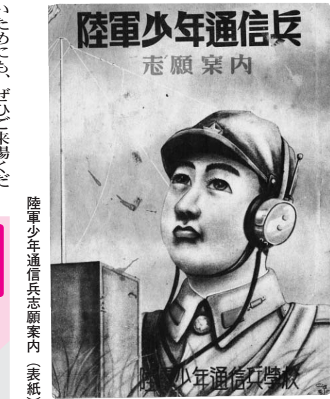
陸軍少年通信兵志願案内(表紙)

展示期間 7月19日(土)～9月7日(日) 開館時間 午前9時30分～午後5時(入館は午後4時30分まで) ※月曜日休館 場所 ふるさと歴史館(諏訪町1-6-3) 内容 陸軍少年通信兵学校の概要、映画の紹介、無線機等の展示、モリス通信体験コーナー