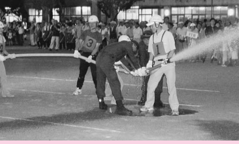
夜間震災訓練のようす

講演会 陸軍少年通信兵学校 日時 8月2日(土) 午後2時～4時 場所 ふるさと歴史館 定員 先着80名 内容 陸軍少年通信兵学校生徒の募集や試験、陸軍少年通信兵学校と東村山について