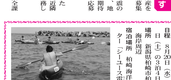
カヌー体験のようす

「なぎさ体験塾」参加者募集 夏の日本海で地元の小学生と一緒に、海洋スポーツ体験や漁業体験にチャレンジしてみませんか。 市では、姉妹都市の柏崎市の皆さんとの交流を深めるとともに、様々な体験を通して子どもたちの豊かな人間性をはぐくむため、「なぎさ体験塾」を開催します。 日程 8月20日(水)～23日(土)の3泊4日 場所 新潟県柏崎市柏崎港海岸周辺 宿泊場所 柏崎海洋センター「シーユース雷音」 ※本事業は、東京都市長会「多摩・島しょ子ども体験塾」助成事業です。 主催 東村山市教育委員会 共催 新潟県柏崎市教育委員会 事前説明会の開催 日時 8月10日(日) 午前10時から 場所 北庁舎第2会議室 問い合わせ 教育部社会教育課