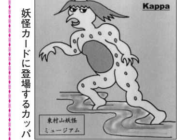
妖怪カードに登場するカッパ

今年夏の夏まつりでは、ふるさと歴史館にいろいろな妖怪たちが集まります。ゲームや工作に挑戦して、妖怪カードを手にしましょう。 日時 7月27日(日) 午前9時30分～午後3時 場所 ふるさと歴史館(諏訪町1-6-3) 内容 ゲーム、工作ほか