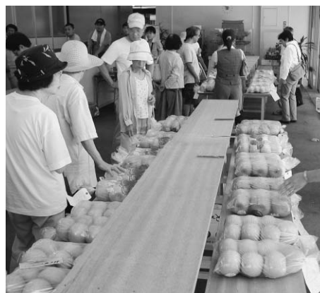
昨年の展示即売会のようす