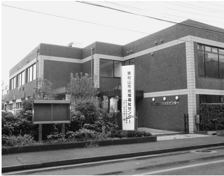
東村山市地域福祉センターの外観