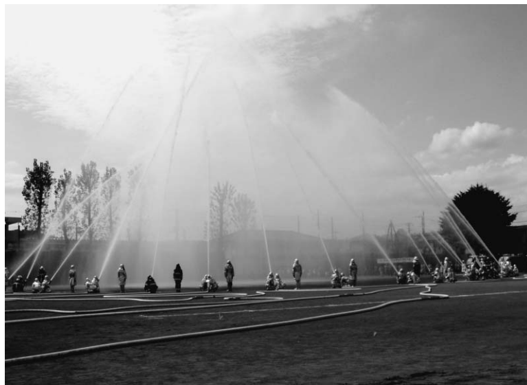
一斉放水のようす

日時 9月28日(日) 午前10時～11時50分(パレードは午前8時50分出発) 場所 東村山中央公園芝生広場(富士見町5-4) ※荒天時は富士見小学校体育館で式典のみ実施します。 ※富士見小学校に駐車場を用意していますが、台数に限りがあります。なるべく、徒歩か自転車でご来場ください。