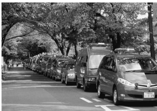
パレードのようす