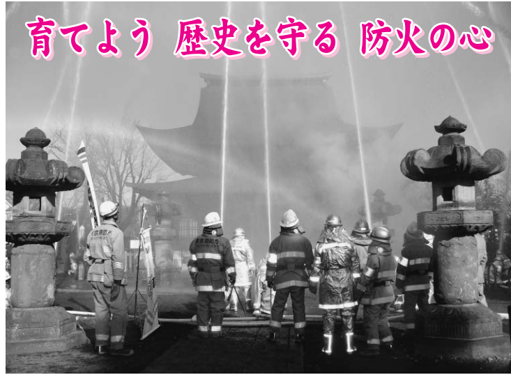
昨年の正福寺地藏堂での訓練の様子

文化財防火デーは昭和30年に制定され、今年で55回目を迎えます。市内には、東京都では唯一の国宝の建造物である正福寺地藏堂のほか、国・都指定された文化財が、現在30あります。