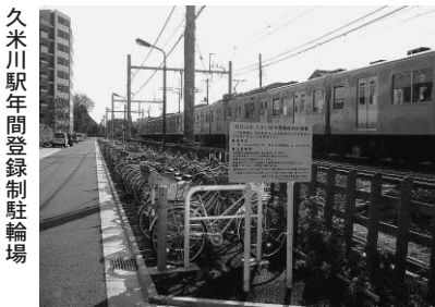
久米川駅年間登録制駐輪場

平成21年度の「久米川駅年間登録制駐輪場」利用者を募集します。利用期間は、年度単位（4月1日～翌年3月31日）となります。21年度から使用料が値下げになりますので、ぜひご利用ください。 ※自動更新はできません。年度ごとに申込みが必要です。 利用車種 自転車 収容台数 230台 年間使用料 9千600円（学生・心身障害者は7千200円）