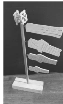
こいのぼりの制作例

日時 4月4日(土) 午前9時~正午 場所 とんぼ工房(秋水園内・秋津町) 対象 市内在住の一般のかた 定員 先着6名 参加費 800円(材料費) ※道具は貸与 申込み・問い合わせ 3月19日(木) 午前10時から電話で